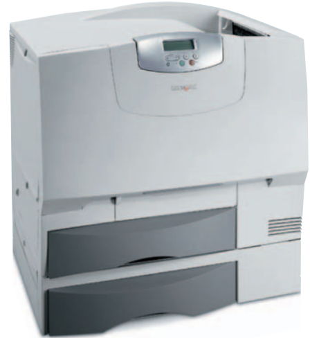
Lexmark C762: Ausgerüstet mit einem optionalen Medienfach für wetterbeständige Polyesterfolie.

Im kommunalen Bereich ist der Einsatz in Parks, Zoos, botanischen Gärten, aber auch in Innenräumen wie Freizeitbädern und Thermen interessant. Für Gastronomieketten oder Cateringanbieter sind die Farbdrucke eine schnelle und günstige Alternative zu laminierten Karten oder Aushängen.