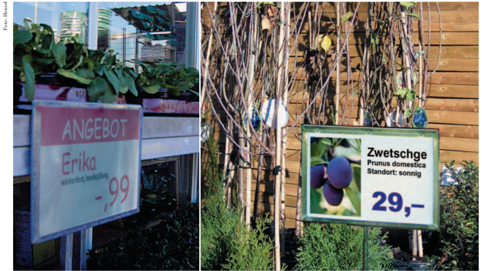
Bislang: Farbausdrucke im Außenbereich verblassten und wurden unansehnlich. Heute: Dauerhaft leuchtende Farben.

Besonders interessant ist diese Lösung für den Einzelhandel. Denn damit wird die moderne Preisauszeichnung mit farbigen Bild-Preis-Plakaten erschwinglich. Digitaldrucke auf Spezialfolien oder Laminierten waren in der Vergangenheit oft zu teuer oder zu aufwändig, Einsteckhüllen