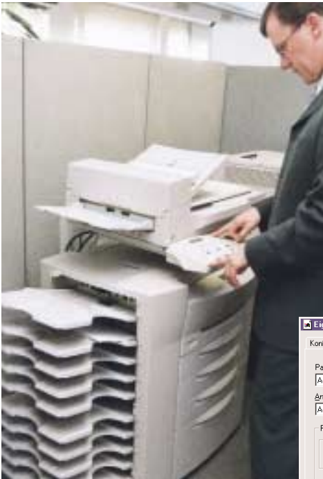
Mit seinen 10 Ausgabefächern ist der Optra W810s das Multitalent für Arbeitsgruppen: Scanner, Fax, Kopierer und Drucker in einem.