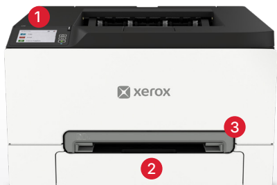
Xerox® C240 Farbdrucker